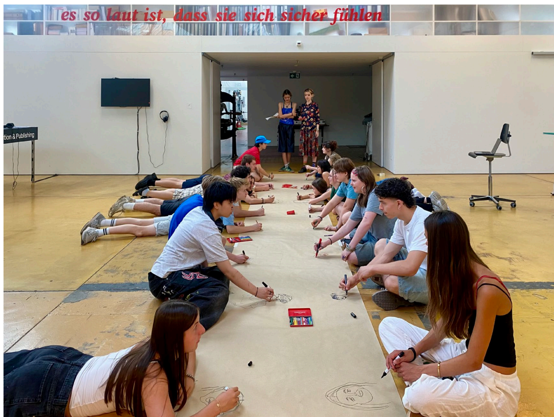
IW27 GYM1: alle Schüler*innen der Klasse 30f zu Besuch bei der TaF G&K an der HKB