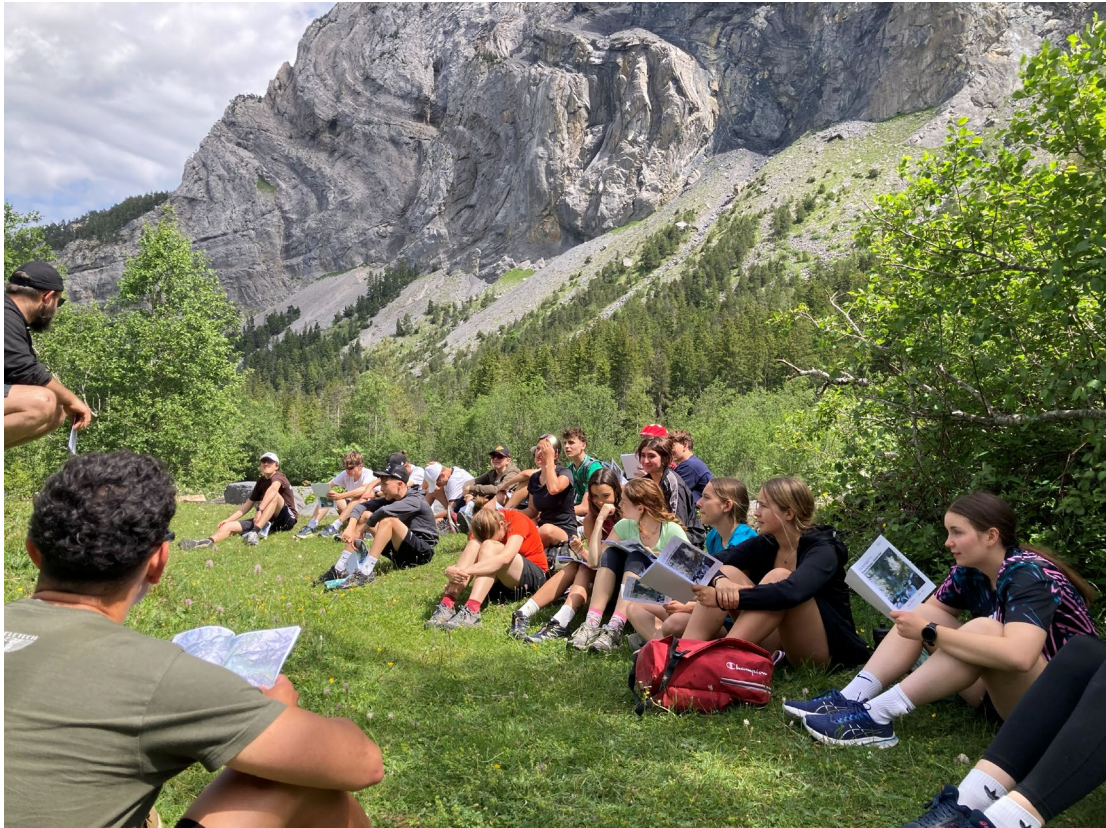
GYM1: Unterwegs in der Geo-Sport-Woche vom Gasterntal bis zum Neuenburgersee.