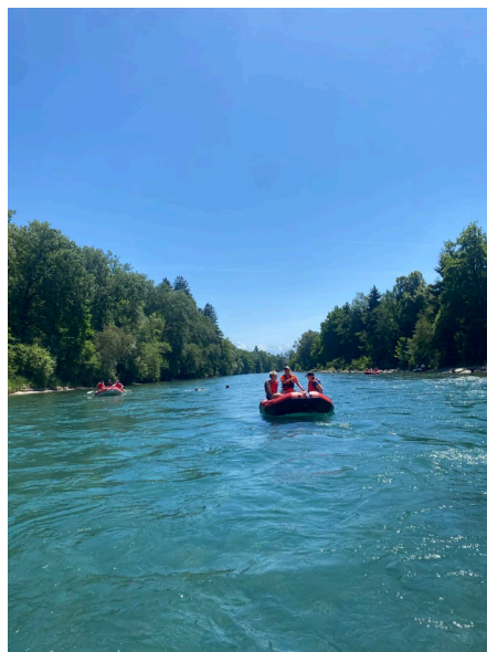
GYM1: Unterwegs in der Geo-Sport-Woche vom Gasterntal bis zum Neuenburgersee.