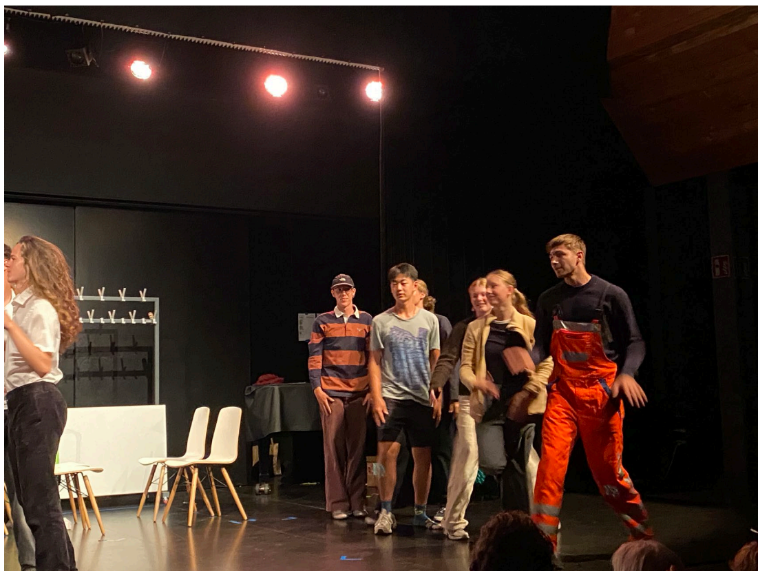
Soirée théâtre: "Contes et métro", 9.-11. September 2025