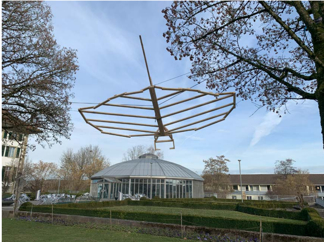
Fliegender Rochen aus dem Modul Körper Raum, TaF GYM2/3.