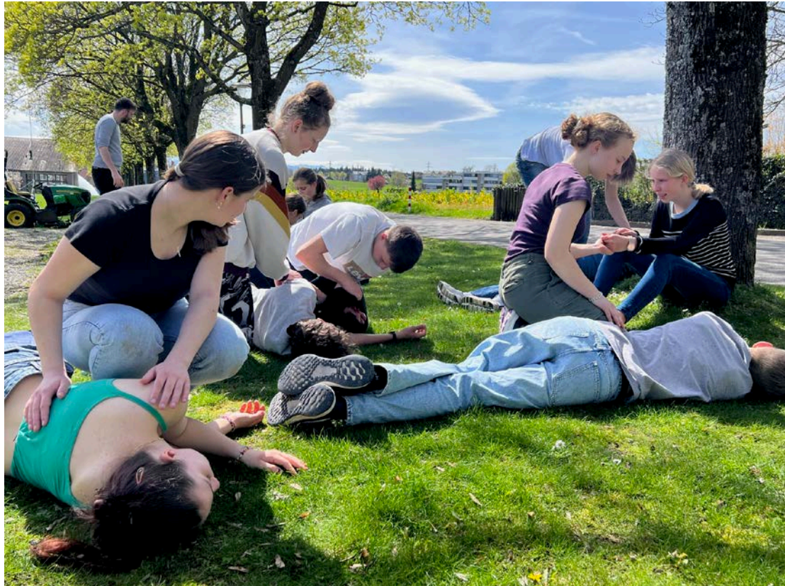
Lebensrettende Sofortmassnahmen im Nothilfekurs GYM1 (IW14)